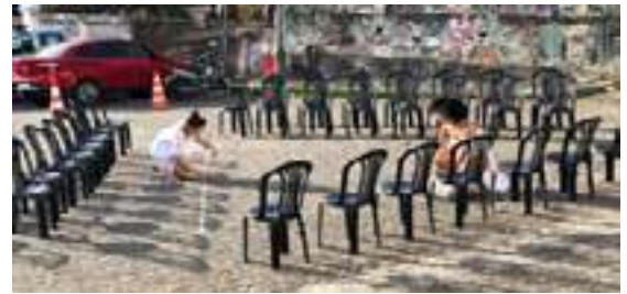
Montagem de cenário e espetáculo | ago 2018.