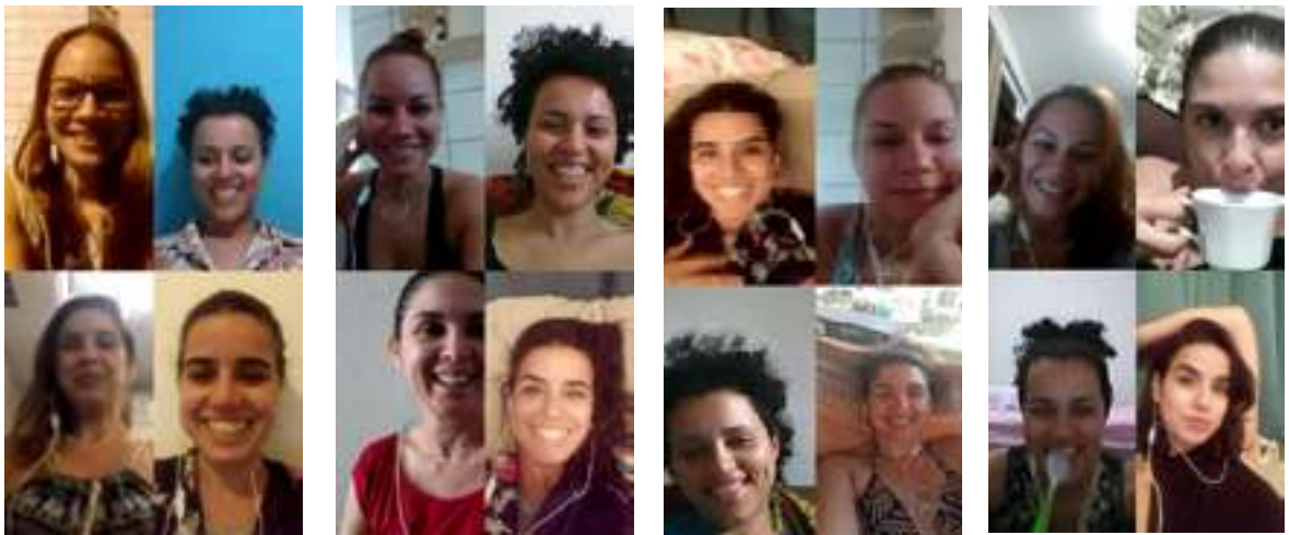
Imagens extraídas das reuniões on-line, agora com Jinarla | de ago a nov 2018.

lebrar este momento conosco, contando um pouco da trajetória daquela de quem descendem e que lhes conferiu suas características mais preciosas.