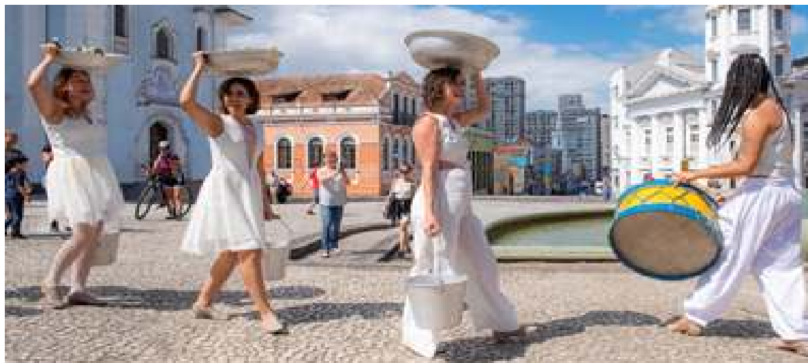
Abaixo – Apresentação em Curitiba, abril de 2019. Novos figurinos.

rilidade com as quais nos desenham as mulheres. Manchamos e sujamos conforme somos e rejeitamos o lugar de candura que nos destinam.