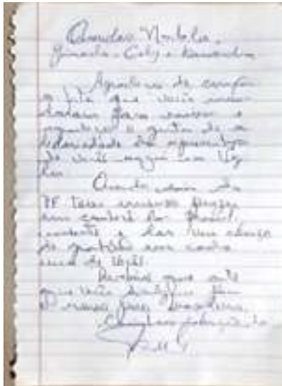
Carta enviada pelo ex-presidente Lula ao grupo Parahyba Rio Mulher e matéria no jornal registra o acontecimento. Abril de 2019.