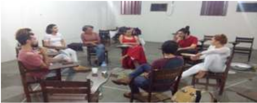
Ao lado – Conversa após um dos ensaios com convidadas e convidados | ago 2018.