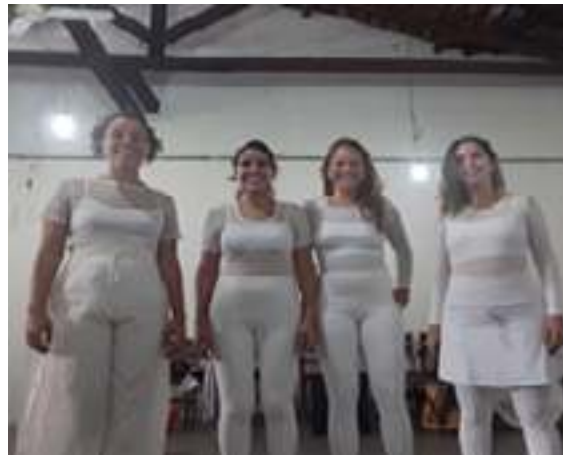
Propostas que não se efetivaram (esq.), Figurino utilizado em um primeiro momento (dir.) | ago 2018.