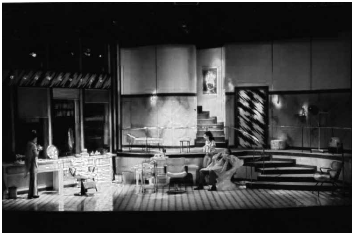
Corte fatal.

Rossi. Ai é um diálogo de referência também. Por exemplo, não adianta eu fazer vermelho se você vai usar luz vermelha. Vamos combinar o que é melhor. Quantas vezes já fiz cenários em que a cor era xis e o iluminador jogava xis, a mesma cor em cima. Qual dos dois está equivocado? Se ele vai jogar vermelho em cima de vermelho, me fala que faço o meu vermelho texturizado para dar uma profundidade. Acho que todos têm que participar da criação como um todo. O cenógrafo tem que passar pelo iluminador, pelo figurinista. Uma coisa está ligada a