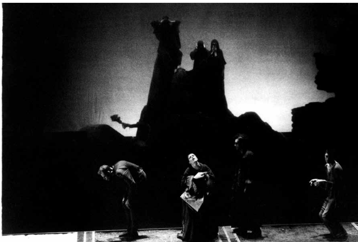
Matto Grosso , direção de Gerald Thomas, 1989.