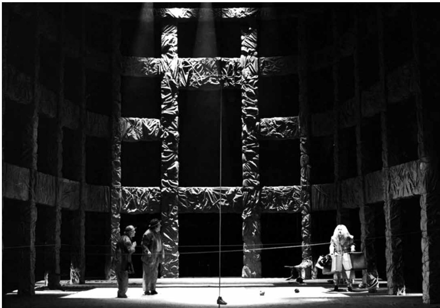
Warten auf Godot, Munique, 1991.